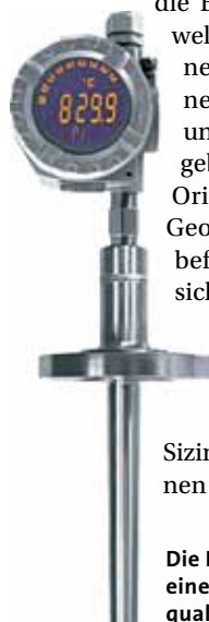
Die Prozesstemperatur ist sowohl eine sicherheits- als auch eine qualitätsrelevante Größe

Die Handhabung im Sizing Thermowell gestaltet sich intuitiv. So werden, wenn im Selection-Teil ein Schutzrohr gewählt wurde, die Parameter der Schutzrohrgeometrie für die Berechnung im Sizing Thermowell direkt übernommen und können im Anschluss daran gegebenenfalls angepasst werden. Kurze und teilweise bebilderte Hilfetexte geben einfache und anschauliche Orientierung über die einzelnen Geometrieparameter. In den Eingabefeldern der Prozessdaten lassen sich die einzelnen Prozessparameter modifizieren oder mithilfe eines Dummy-Mediums einfach spezielle Mediumsdaten vorgeben. Im Ergebnis-Teil des Sizing Thermowell sieht man auf einen Blick, ob mit dem ausgewählten