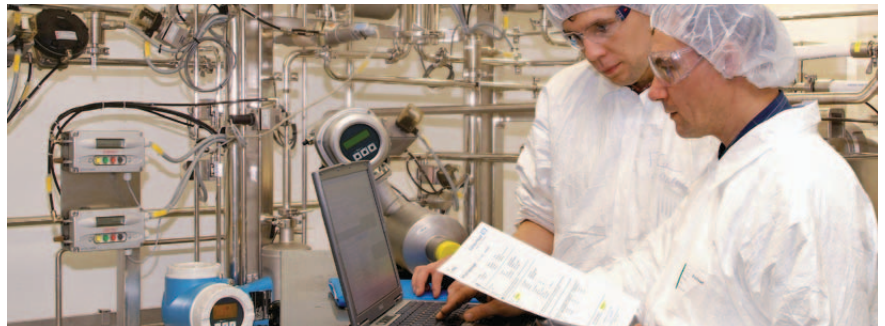
Kalibriermanagement verbessert den Anlagenbetrieb